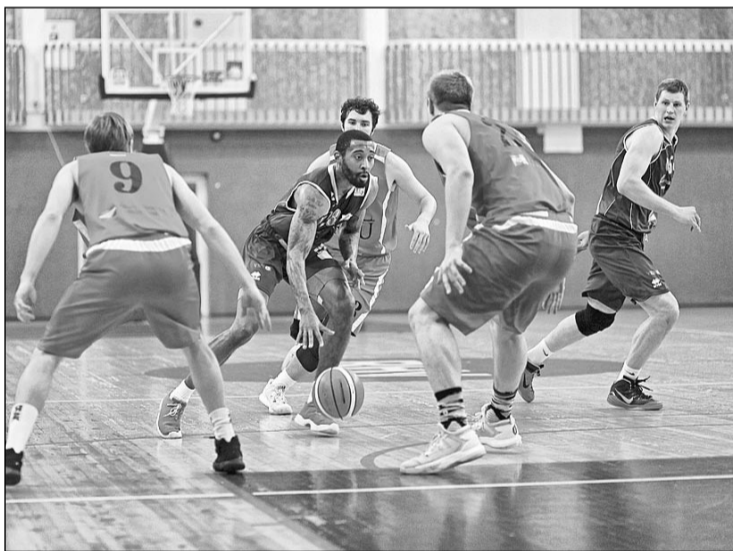
BK "Madona"/BJSS un "RSU" spēle.

Trešās ceturtdaļas sākumā nepilnas minūtes laikā "Madona"/BJSS guva piecus punktus pēc kārtas, rezultātu samazinot līdz minus 4 — 49 : 53. Diemžēl turpinājumā jaunajiem BK "Madona"/BJSS basketbolistiem metienu precizitāte mazinājās, un pēdējās piecpus minūtēs madonieši nespēja gūt punktus, tādējādi zaudējot ceturtdaļā ar 10 : 7. Pirms pēdējām desmit minūtēm "RSU" bija 16 punktu pārsvars — 70 : 54. Pēdējās desmit